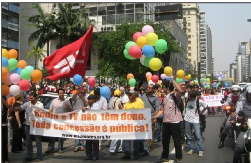
CUT, movimentos sociais e intervozes na Paulista

por somente 12% da população. As gravadoras independentes, que produzem 70% da música nacional, contam com insignificantes 8% do espaço de difusão no rádio e TV, enquanto que os oligopólios, embora gravem apenas 9% da nossa imensa e rica diversidade musical brasileira, controlam 90% do espaço de difusão em rádio e TV. São dados levantados pelo Centro Popular de Cultura(CPC-UMES) que ilustram a grave situação a que vem sendo relegada a cultura nacional.