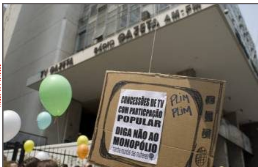
Cresce a mobilização popular contra o latifúndio midiático